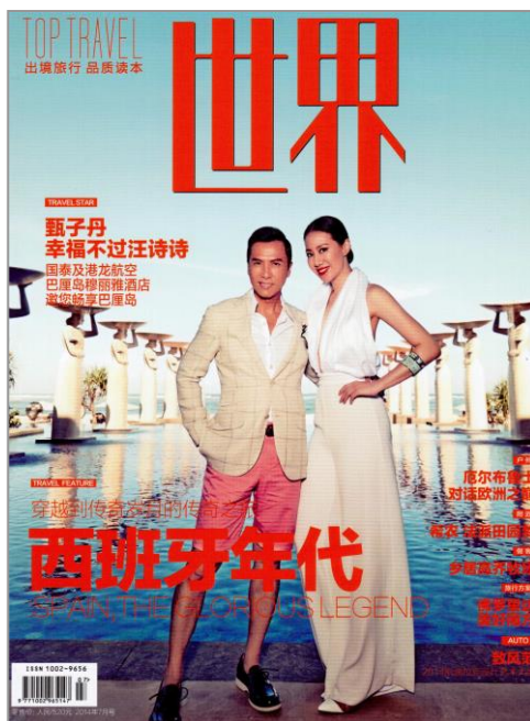
——K91 000025 《世界》

西班牙从来不缺少传奇。非洲与欧洲在此激情碰撞,成就了无数个闪亮的历史瞬间。这期间,传奇与故事、辉煌与暗淡、创造与毁灭、生命与荣誉,谱写出的是一曲跌宕起伏、韵律独具的深歌。在漫无止境的朝圣道路上,古老的教堂、修道院、朝圣者客栈以及一些地名永久的纪念着今人无法想象的宗教热情。不置身处地,便无法感受和膜拜哪些最初的荣耀和延续至今的激情。“西班牙”这三个字,代表的不仅是一个国度,而且是一个不可复制的年代、一段光耀古今的传奇。